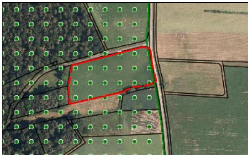
Abbildung 2: Luftbild der herauszunehmenden Fläche (rot umrandet) mit Darstellung der aktuellen Grenze des Landschaftsschutzgebietes

Aus dem Landschaftsschutzgebiet herausgenommen werden soll in der Gemarkung Tretzendorf die Flächen der Flurnummer 801 im Umfang von 1,03 ha.