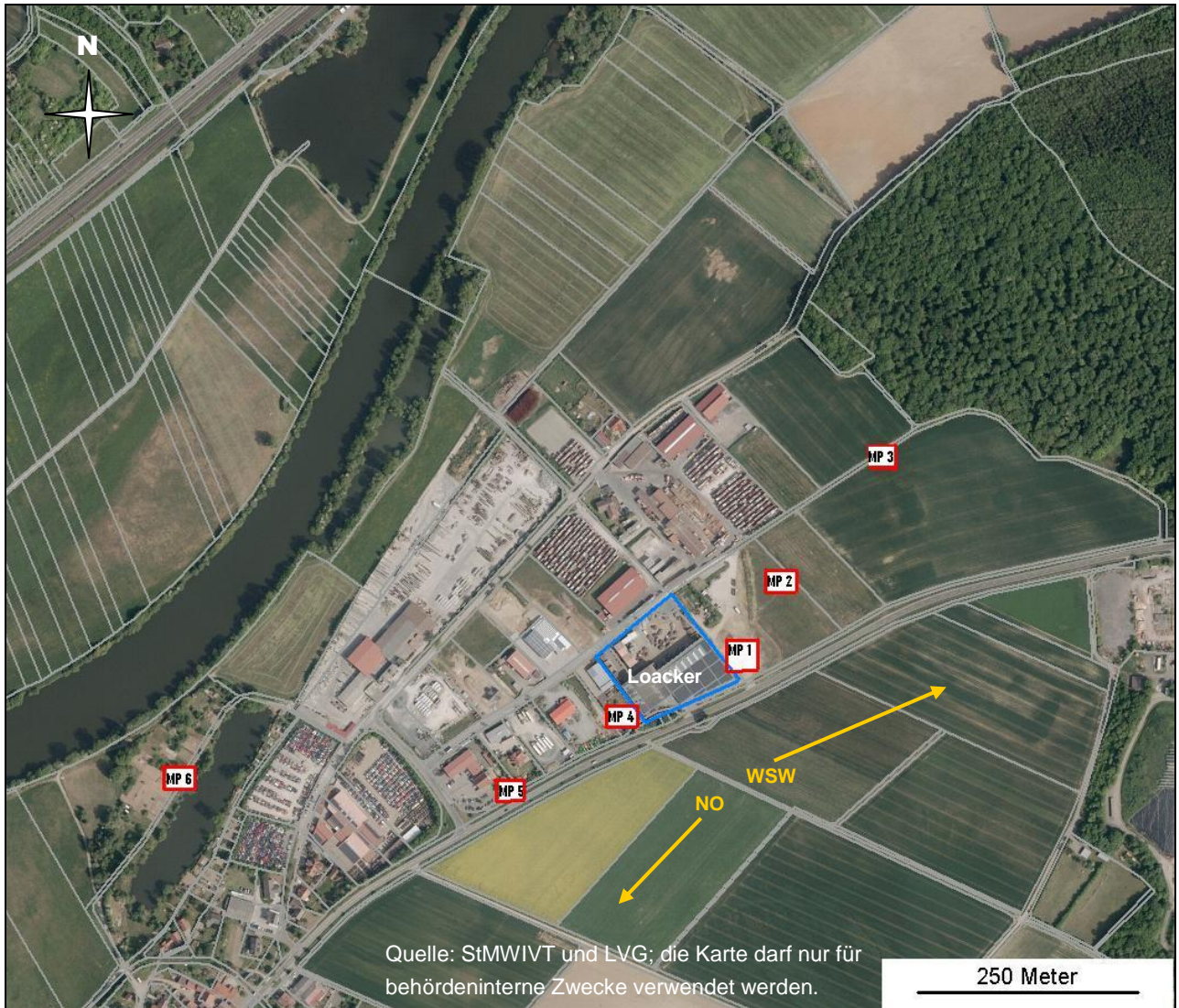
Abbildung 1: Messpunkte im Umfeld der Fa. Locker, Hauptwindrichtungen